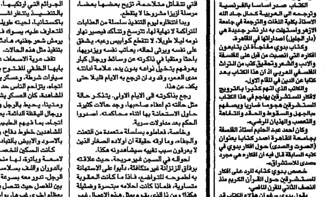
لعبد الرحمن بدوي